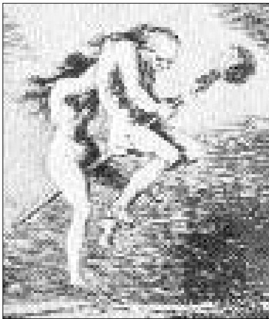
Barlot da strias e striuns.